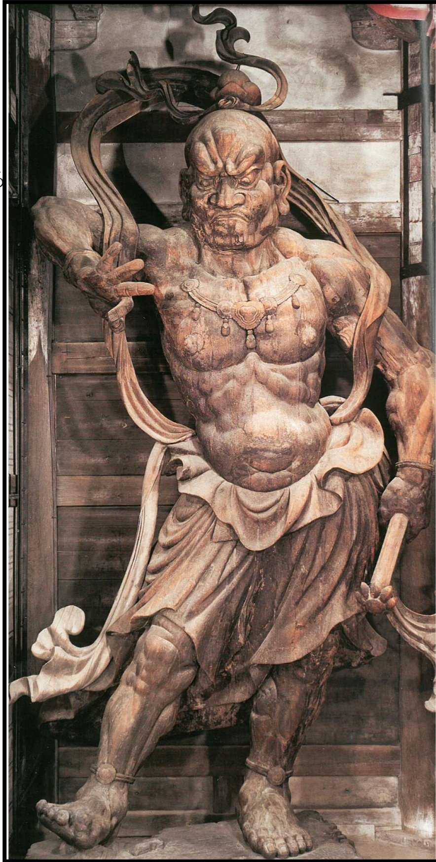
金剛力士立像（吽形） ヒノキ／寄木造り／彩色／高さ 842cm 運慶 東大寺蔵（奈良県）

どのような方法を使っても良いが、鉛筆描き（シャープペンシル可）で左の図版を右の枠に模写しなさい。 ※背景も含め明暗ごと模写すること。